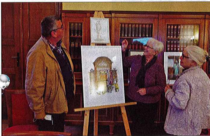
Angeregte Gespräche von Besuchern des Vortrages über die ausgestellten Werke des Malteams Glauchau zum Thema „Friedhof“, Foto: Peter Dittmann

Am 13. Oktober fand erstmalig ein heimatgeschichtlicher Abend in der Stadt- und Kreisbibliothek Glauchau statt. Eingeladen von der Bibliothek, wurde mir als Hobbyhistoriker Gelegenheit gegeben, in dem gut gefüllten Lesesaal ausgewählte Geschehnisse zwischen zwei stadthistorisch wichtigen Jubiläen vorzustellen: von der Friedhofseinweihung (2019: 150-jähriges Jubiläum) bis zur Scherbergbrücke (2023: 100-jähriges Bestehen). Die Besucher erfuhren viel Neues und Verbindendes anhand einer Foto-Präsentation sowie mehrerer Episoden und Geschichten. Auch die Zeichnungen des Malteams Glauchau zum Friedhofsjubiläum wurden nochmals präsentiert.